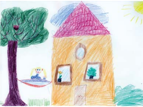
Abb. 1: Haus-Baum-Mensch. Darstellung der kleinen Patientin, in der sehr gut das Harmoniebedürfnis der Patientin zur Darstellung kommt.

gen nach Schokolade habe, sich selbst unter Druck setze, d.h. auch sehr pflichtbewusst und ehrgeizig sei und ausgesprochen strukturiert. Sie vertrage keinen Streit und suche Harmonie.